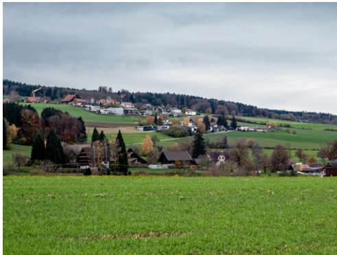
Sicht auf Geltwil (Eddy Schambron)