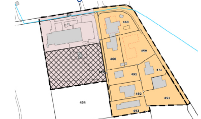
Ausschnitt Spezialzone mit besonderen Zweckbestimmung (rev. Bauzonenplan, Stand 11. Oktober 2022)