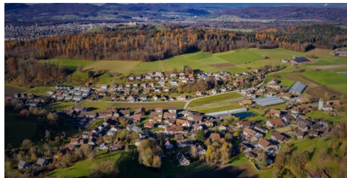
Ammerswil Sicht auf das Dorf